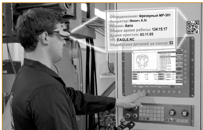
Рис. 2. Применение технологии дополненной реальности для визуализации информации, собранной с разнородного технологического оборудования

На каждом технологическом оборудовании, задействованном в технологическом процессе, за которым